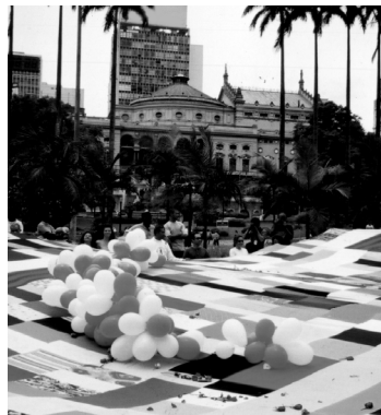
Fotografia de parte de uma colcha e da apresentação de uma colcha no Largo do Anhangabaú (2002).

Utilize este espaço para rascunhar o retalho da sua memória. Ele pode ser entregue pessoalmente nos pontos de referência ou fotografado e enviado por email educativo@casaum.org